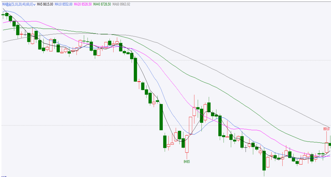
图 3 90 日期期货行情走势

截止本周四，红枣期货合约 CJ109 开盘 8730，最高 8845，最低 8650，收盘 8690，涨-95 元/吨，涨幅-1.08%，成交量 93956 手，持仓量 53612 手，日增仓 106 手。