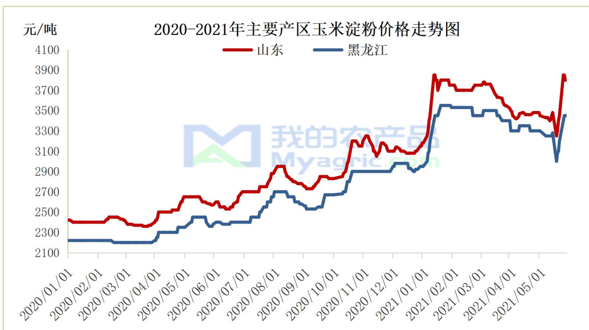
图 1 2020-2021 年玉米淀粉主要产区价格走势

2021年5月，玉米淀粉价格稳中偏强运行，华北地区价格出现上涨，东北地区表现稳定。截止31日，全国玉米淀粉均价为3461元/吨，环比4月底上涨30元/吨。月初，玉米淀粉市场下游需求疲软，购销气氛清淡淀粉库存持续攀升。受需求压制，玉米淀粉价格持续下行，华北地区主流报价跌至3400-3450元/吨左右，价格在低位持续徘徊。五月中旬，深加工企业玉米到货较少，玉米收购价格上调。成本上涨上游企业提涨心态较强叠加下游市场积极补库，市场成交反响良好，购销气氛明显好转短期工厂销售压力得到缓解。受此影响，玉米淀粉价格触底反弹，华北地区报价逐步攀升至3450-3500元/吨左右，东北地区价格稳定。5月底，玉米淀粉价格维持高位震荡，上游企业挺价心态较强，下游企业维持随采随用，市场波动幅度较小。