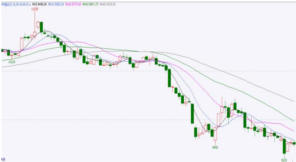
图 3 90 日期货行情走势

截止本周四，红枣期货合约 CJ109 开盘 8540，最高 8590，最低 8455，收盘 8500，涨-25 元/吨，涨幅-0.29%，成交量 58351 手，持仓量 44979 手，日增仓-1385 手。