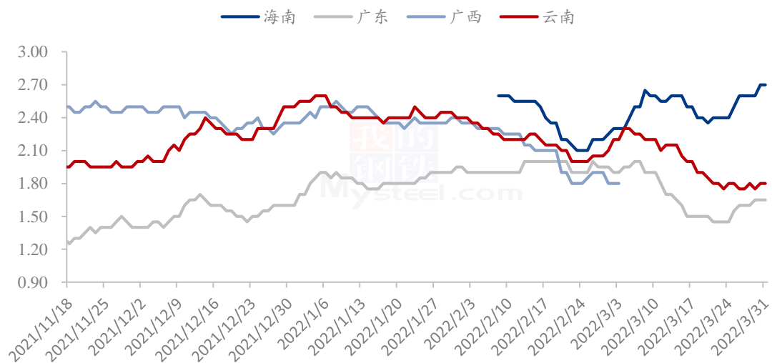
香蕉主产区好货平均价格（元/斤）