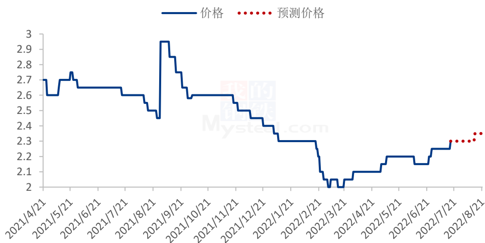
(2021-2022年) 赤峰张杂13号谷子价格走势 (元/斤)

产区持货粮商存在挺价心态，对原粮价格形成利好支撑，价格暂时稳定。，Mysteel 农产品认为短期谷价应无下滑风险，关注中下旬贸易主体操作变化，若出现集中压货或补货行为，价格或将小幅上调。