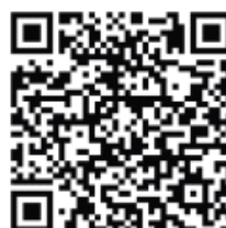
（期、现货铜交易微信）