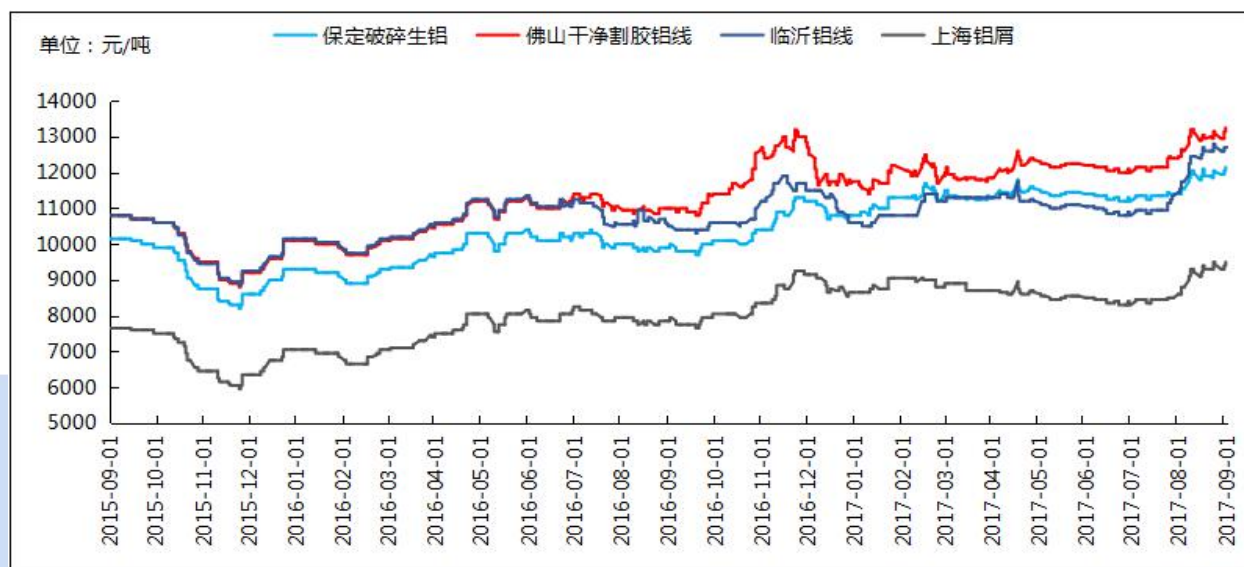
图2 国内废铝价格走势

本周各地区废铝价格较上周震荡上行，主要受铝锭现货价格坚挺以及环保政策集中落实的关键时期所影响，主流消费地：河南、佛山、山东、浙江、重庆等地区废铝出货一般，多在贸易商之间流通，中小型铝合金锭厂以及压铸厂开工率因环保集中关停等压力开工率很低，大型铝合金锭厂对铝价以及第四季度消费普遍看好，有囤货意识。随着下游加工企业以及终端消费市场逐渐接受现行铝价，预计下周废铝价格将保持坚挺上行趋势。