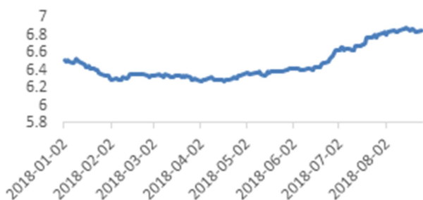
美元兑人民币价格走势